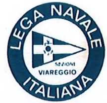
LEGA NAVALE ITALIANA